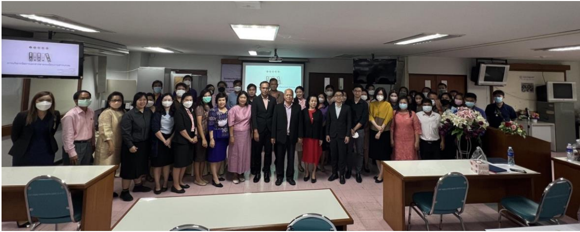
ภาพกิจกรรม วันที่ 19 - 21 เมษายน 2566